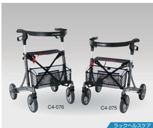
ラックヘルスケア