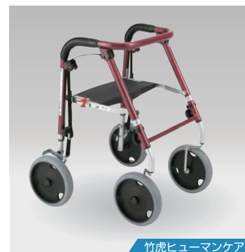
竹虎ヒューマンケア

サイズ：幅600×長さ590×高さ635~785mm 座面高：475mm 重量：7.8kg 材質：スチール