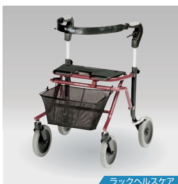
ラックヘルスケア