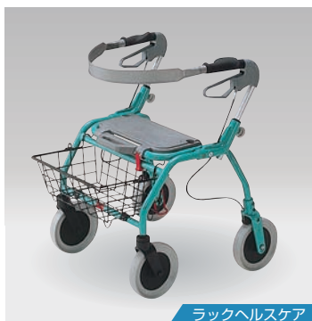
ラックヘルスケア

サイズ：幅615×長さ655mm×高さ705~905mm 座面高：530mm 重量：7.2kg 材質：スチール