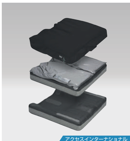
アクセスインターナショナル